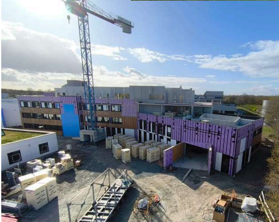
Impression sur papier 100% recyclé